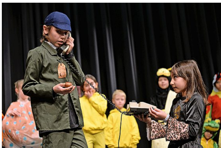
Zoodirektor Müüsli ist abwesend – danach folgt das Chaos.

Zoodirektor Müüsli wird überraschend an die dreitägige Nasenbär-Tagung abberufen. Schweren Herzens muss er seine Tiere alleine im Zoo zurücklassen. Die Schildkröten, Haie, Krebse, Igel und der Papagei nutzen die Gunst der Stunde und schmeissen eine grosse Fete. Es wird getanzt bis in die frühen Morgenstunden. Doch dann die